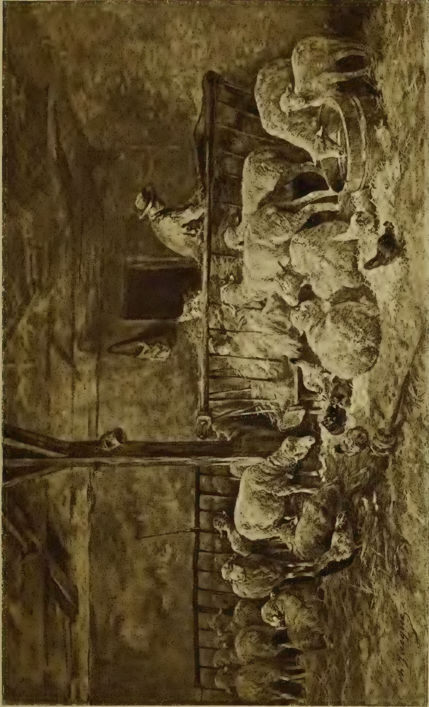
Sheep Pen, (Albion, N. Y.)